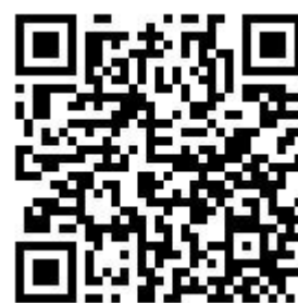
公告網頁 QR Code